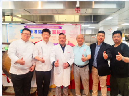
2025. 09. 29~第五屆世界中華廚皇挑戰賽