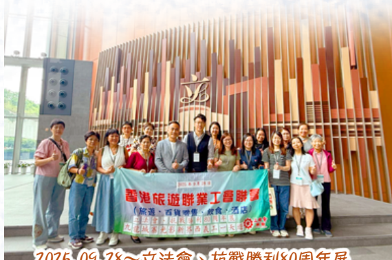
2025. 09. 28~立法會、抗戰勝利80周年展 九龍城寨光影 義工之旅