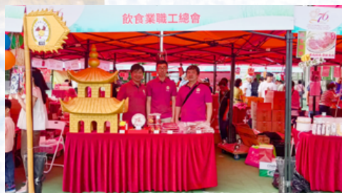
2025. 09. 27~大埔賀國慶76周年攤位