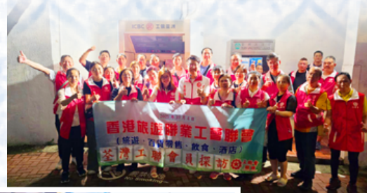
2025. 10. 04~旅遊 聯會-荃灣區家訪