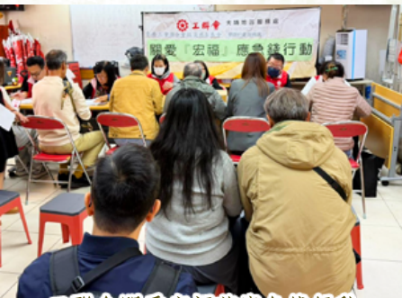
工聯會關愛宏福苑應急錢行動

去年11月26日，大埔宏福苑不幸發生五級嚴重大火，奪去至少168人的寶貴生命，並有大量居民家園盡燬，本會表示深感悲痛，並向逝者致以深切哀悼，對家屬及傷者表示誠摯慰問。