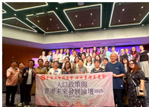
2025. 09. 13~工聯偏委-香港未來發展論壇2025