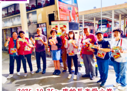
2025. 10. 25~康齡長者愛心券