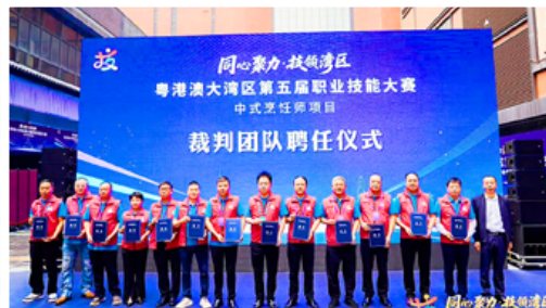
2025. 10. 28~粵港澳大灣區第五屆職業技能大賽