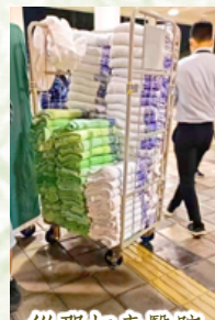
從那打素醫院分發的毛毯