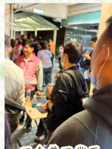
工會義工當天協助當區居民