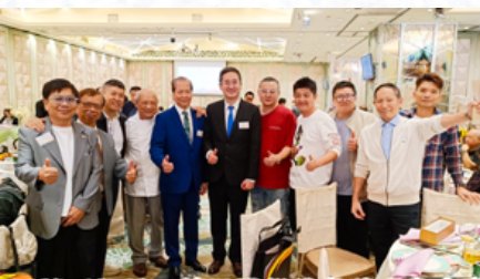
2025. 10. 28~第五屆世界粵菜廚皇大賽