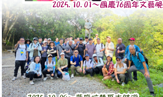
2025. 10. 09~蓬麻坑禁區古跡遊