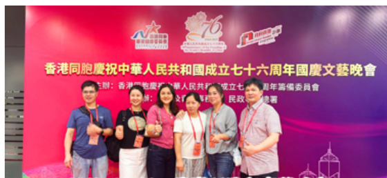
2025. 10. 01~國慶76周年文藝晚會