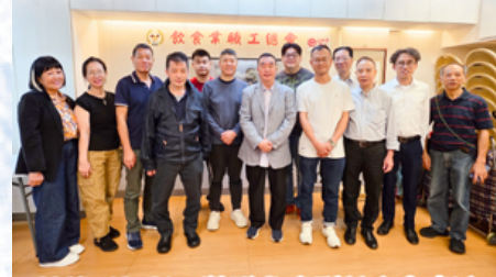
2025. 10. 31~勞聯代表到訪本會交流