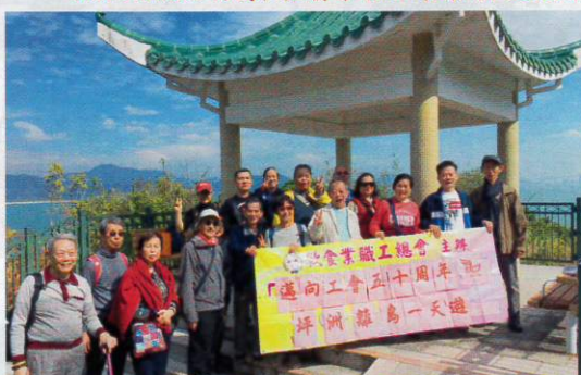
2019.12.09 邁向工會50周年 坪洲離島一天遊