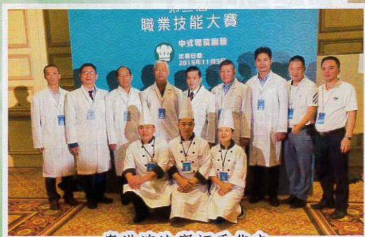
粵港澳比賽評委代表