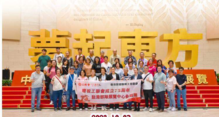
2023. 10. 07 旅港聯會-參觀駐香港部隊展覽中心