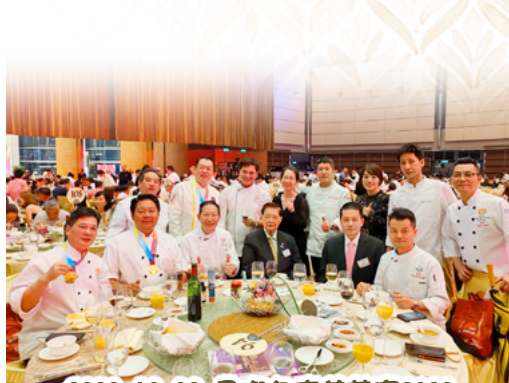
2023. 10. 09 國際名廚總善宴2023