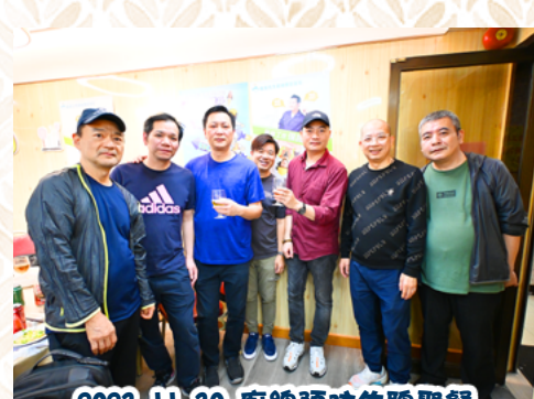
2023. 11. 30 廚總預防失聰聚餐