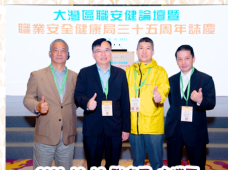
2023. 10. 19 職安局 大灣區 職安健論壇