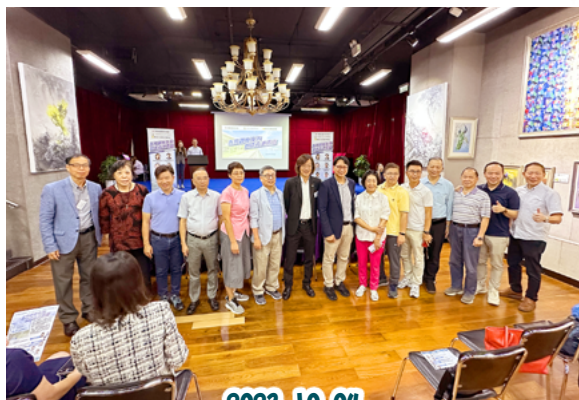
2023. 10. 04 善用觀塘海濱 創造香港價值 分享會