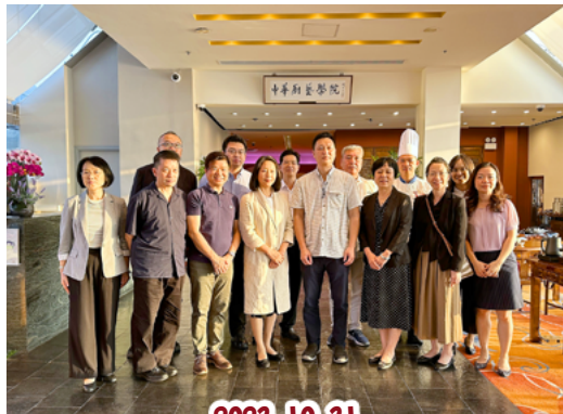
2023. 10. 31 北京市總工會參觀中華廚藝學院