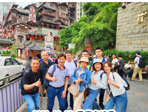
2023. 10. 09 重慶交流團