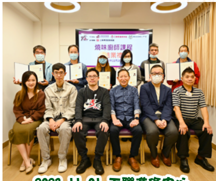
2023. 11. 01 工聯進修中心 太興燒味課程學員畢業禮